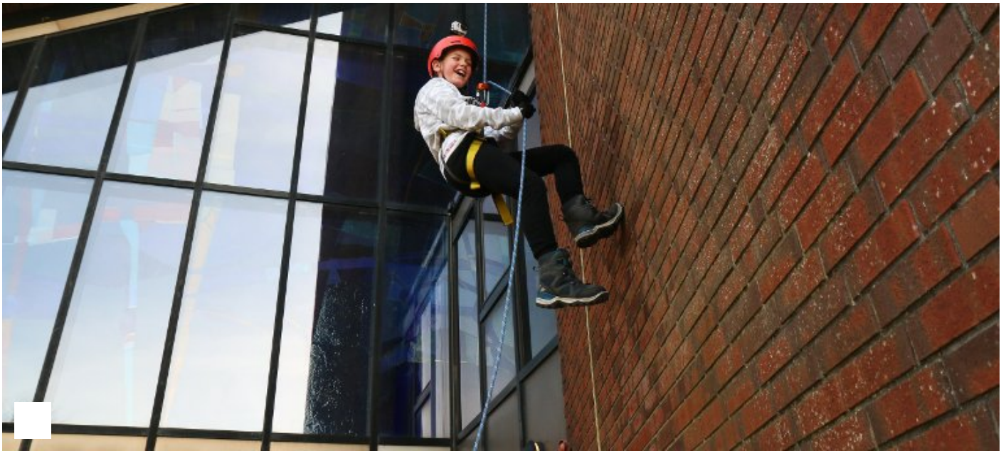
Her går speidarane ned kyrkjetårnet