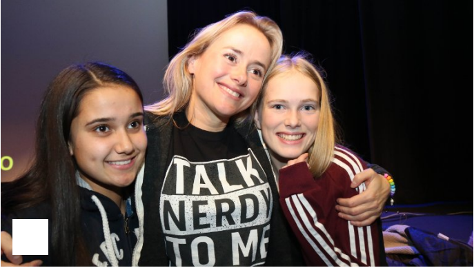
I kø for å sikra seg klem av heile landets "Helsesista"