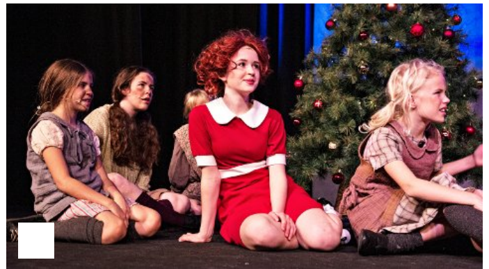
Denne foreldrelause jenta skal fylla Storstova i advent for andre året på rad