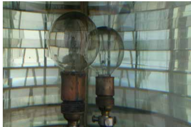
Foto: Fyrlykta på Obrestad