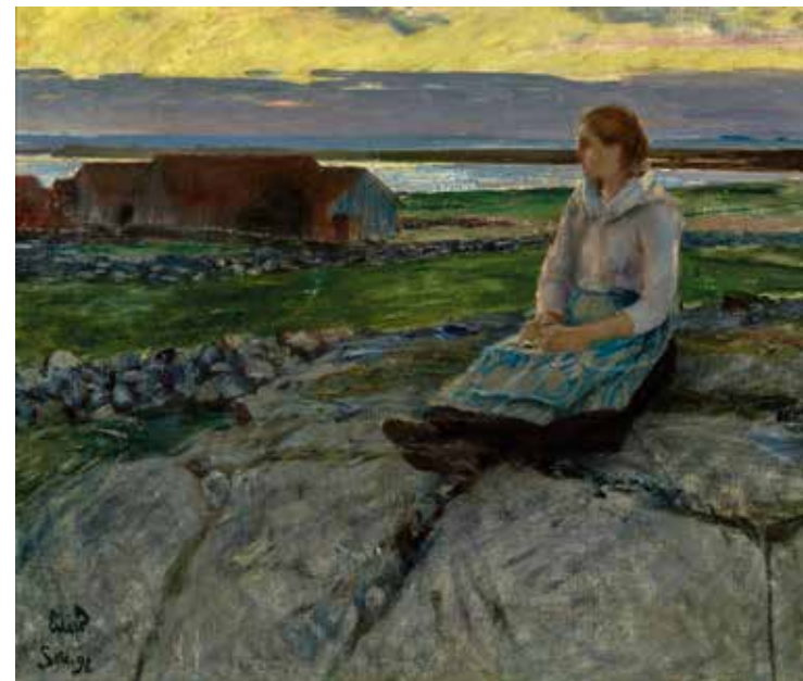
Eilif Peterssen, Kveld (Sele), 1896, maleri

Kr 350,-. Påmelding: post.hgp@ha.kommune.no eller 51 79 16 60.