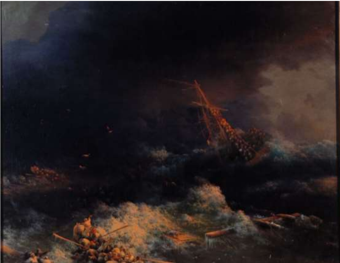
Ivan Ajvazovskij (1817-1900). Skipet Ingermanlands forlis i Skagerak natten til 31. august året 1842. 1876, 95x125 cm, olje på lerret. Tilhører Det sentrale marinemuseet, St. Petersburg