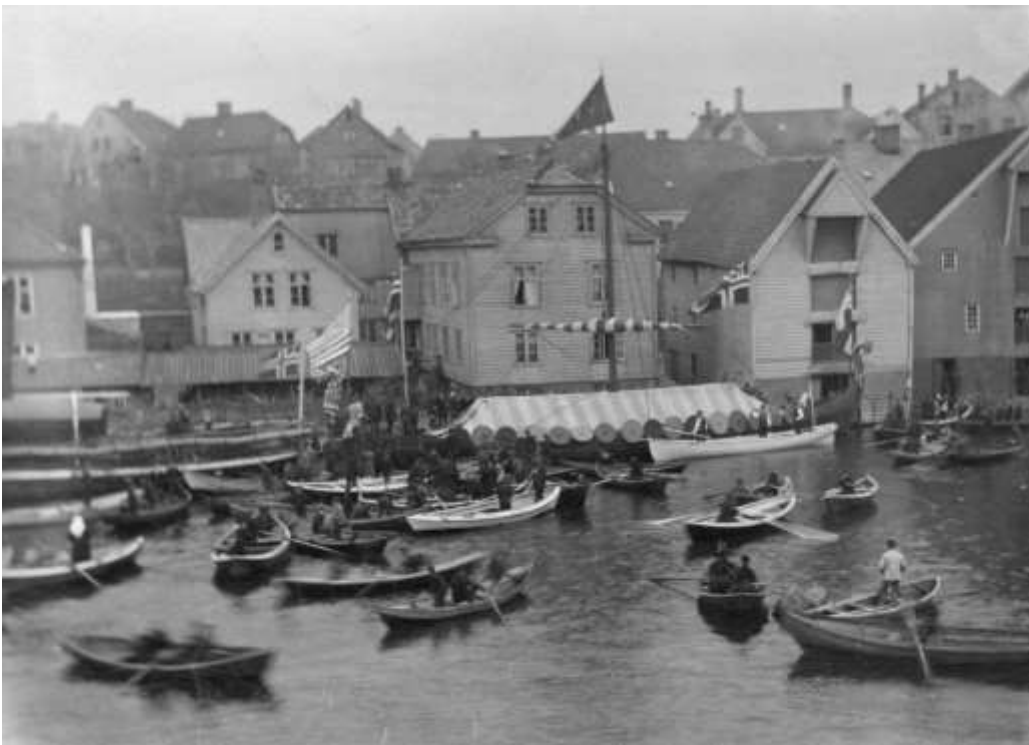
Giggen til Ingermanland, Havnebassenget i Stavanger, 1893.