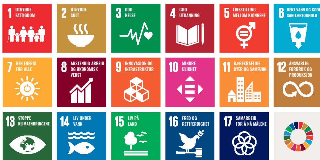
Figur 1. FNs berekraftmål

I 2015 vedtok FNs generalforsamling 2030-agendaen for berekraftig utvikling. Agendaen har 17 utviklingsmål for å fremja sosial, miljømessig og økonomisk berekraft. FNs berekraftmål er verdas felles arbeidsplan, mellom anna for å sikre sosial rettferd og god helse og stanse tap av naturmangfald og klimaendringar. Måla skal vise veg mot ei berekraftig utvikling på kort og lang sikt.