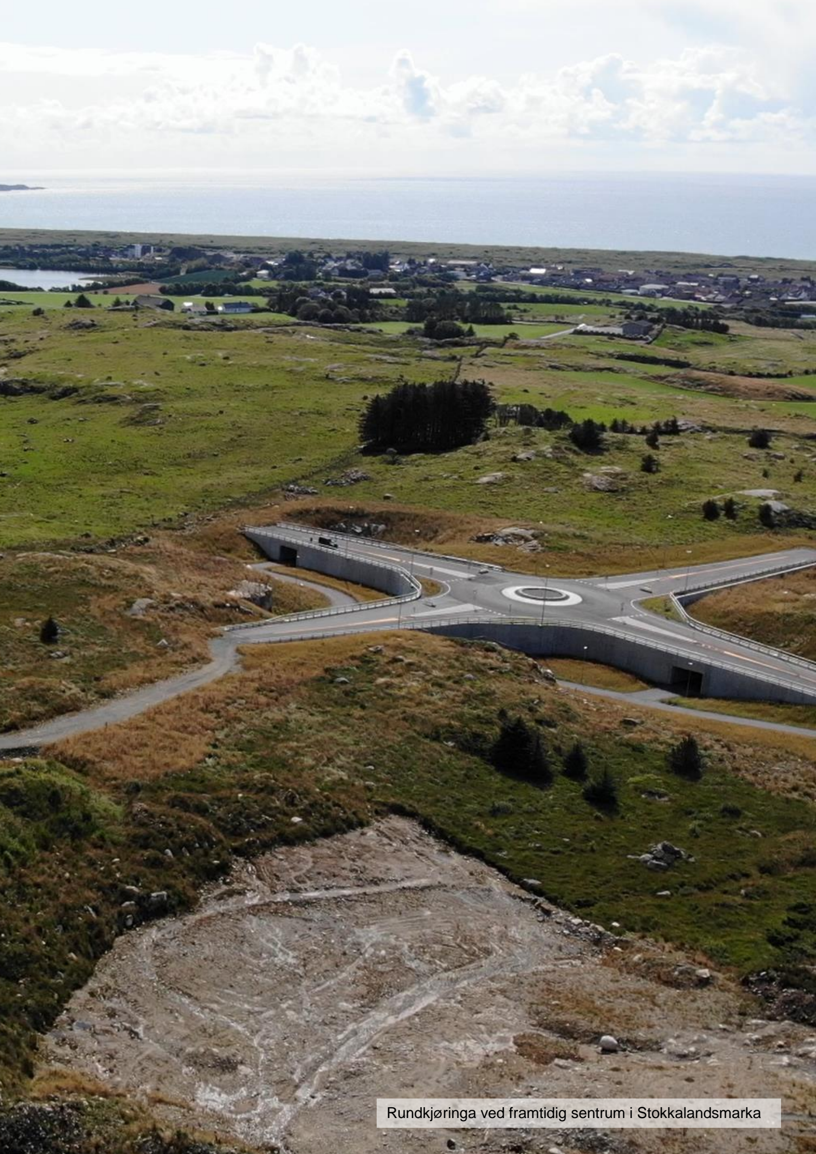
Rundkjøringa ved framtidig sentrum i Stokkalandsmarka