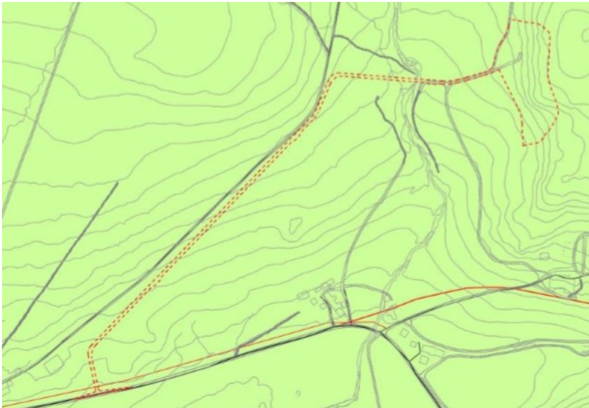
Figur 2 – Planområdet er i gjeldende kommuneplan avsatt som LNFR.