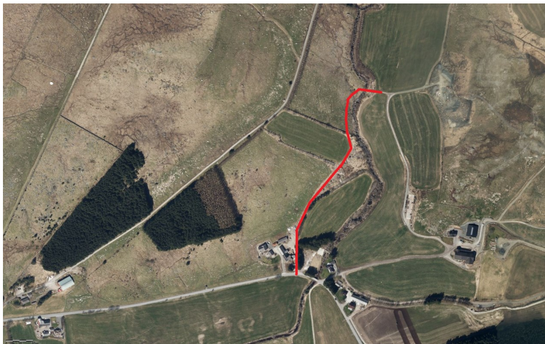
Figur 7 – Fylkesmannes forslag til vegløsning.

Store deler av denne traseen finnes allerede, og den vil gi nødvendig tilgang til jordet ønskes dyrket opp. Fylkesmannen poengterte at siden dette er et midlertidig tiltak, bør det derfor ikke innebære større beslag av store jordbruksareal. De ba samtidig om at det under «Avslutning av masseuttak» i § 3.1.1, så må avsnittet suppleres med at «Ved avsluttet drift skal bruddkantene slakkes, og anleggsbro demonteres og fjernes i løpet av ett år.»