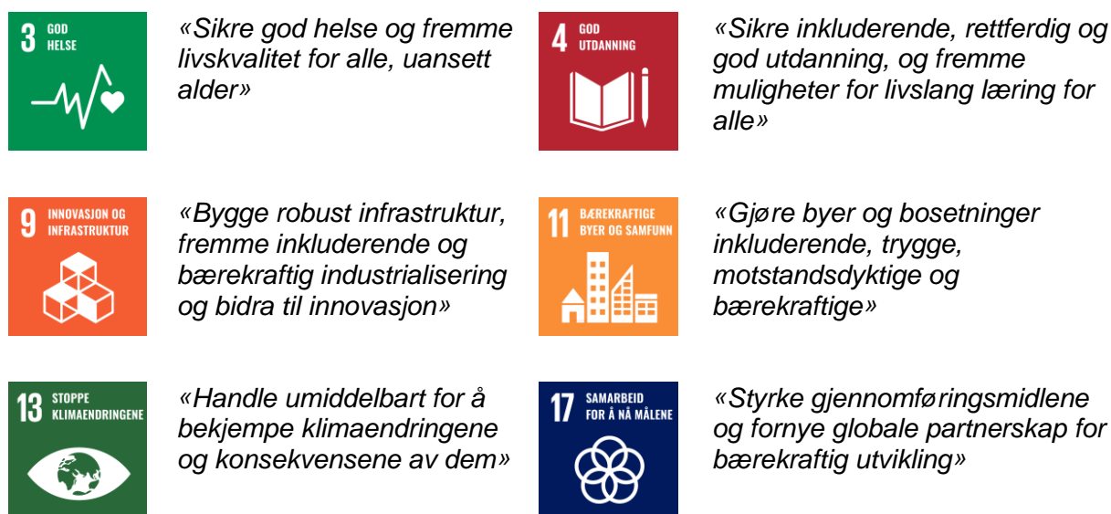
Figur 3. Forslag til berekraftsmål som skal danne utgangspunkt for nye satsingsområde

Med bakgrunn i dei foreslåtte berekraftmåla er det definert følgande satsingsområde for ny kommuneplan: «God helse», «God utdanning», «Innovasjon og infrastruktur», «Bærekraftige tettstader og samfunn», «Stoppe klimaendringane», og «Samarbeid for å nå måla».