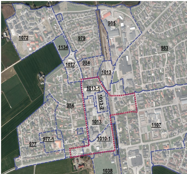
Figur 1 Reguleringsplanar i og nær sentrum