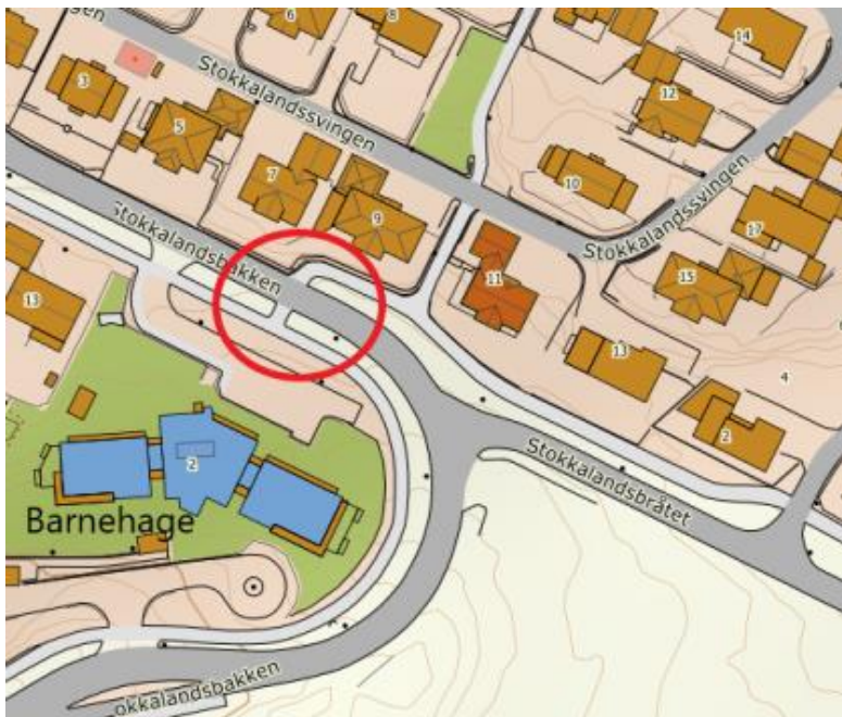
Kartutsnitt med kryssingen markert med rød sirkel

I Stokkalandsbakken ved Stokkalandsmarka barnehage, Vigrestad (gnr.107 bnr.153) ved kryssing gang- og sykkelveg.