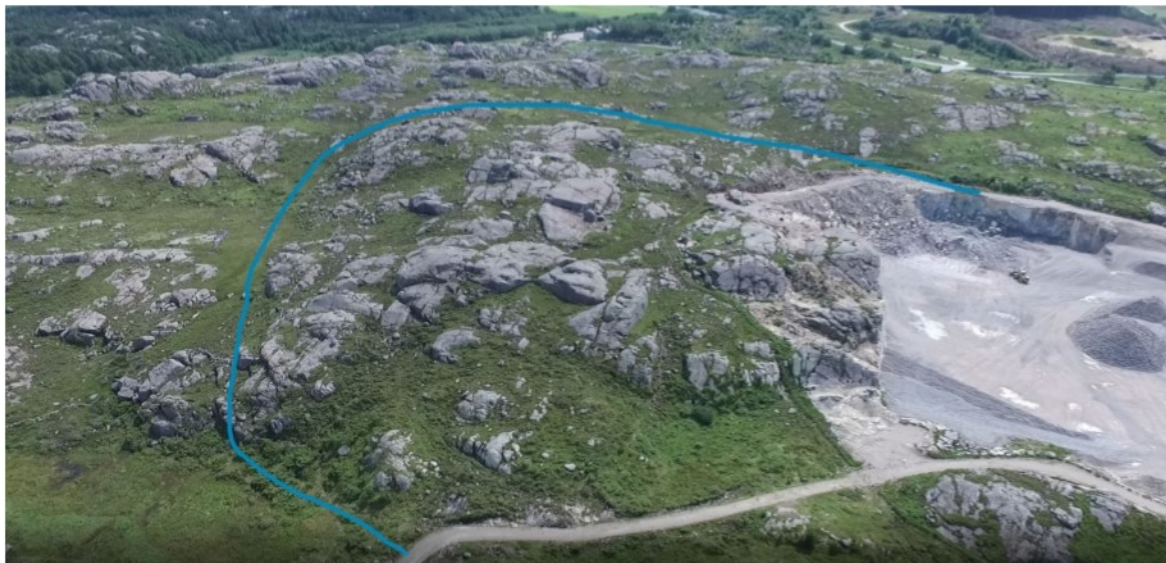
Figur 3 - Ca. omfang av masseuttak

Utvidelsen medfører at høydetraket forsvinner, og erstattes med lavereliggende slak dyrka mark. I tillegg til dette kommer tilsvarende oppfylling nord i planområdet som flater ut landskapet. Det har vært uenigheter om foreslått regulert deponiområdet er et naturlig eller menneskeskapt våtmarksområde. Det er kjent at et mindre tjern, med varierende vannstand, ble demmet opp for noen tiår siden for å sikre vannforsyning til nærliggende åkre, som førte til et større våtmarksområde. Demningen ble senere fjernet og området i stor grad drenert i forbindelse med masseuttak og ny veg. Også den nordligste delen med opprinnelig tjern ble drenert.