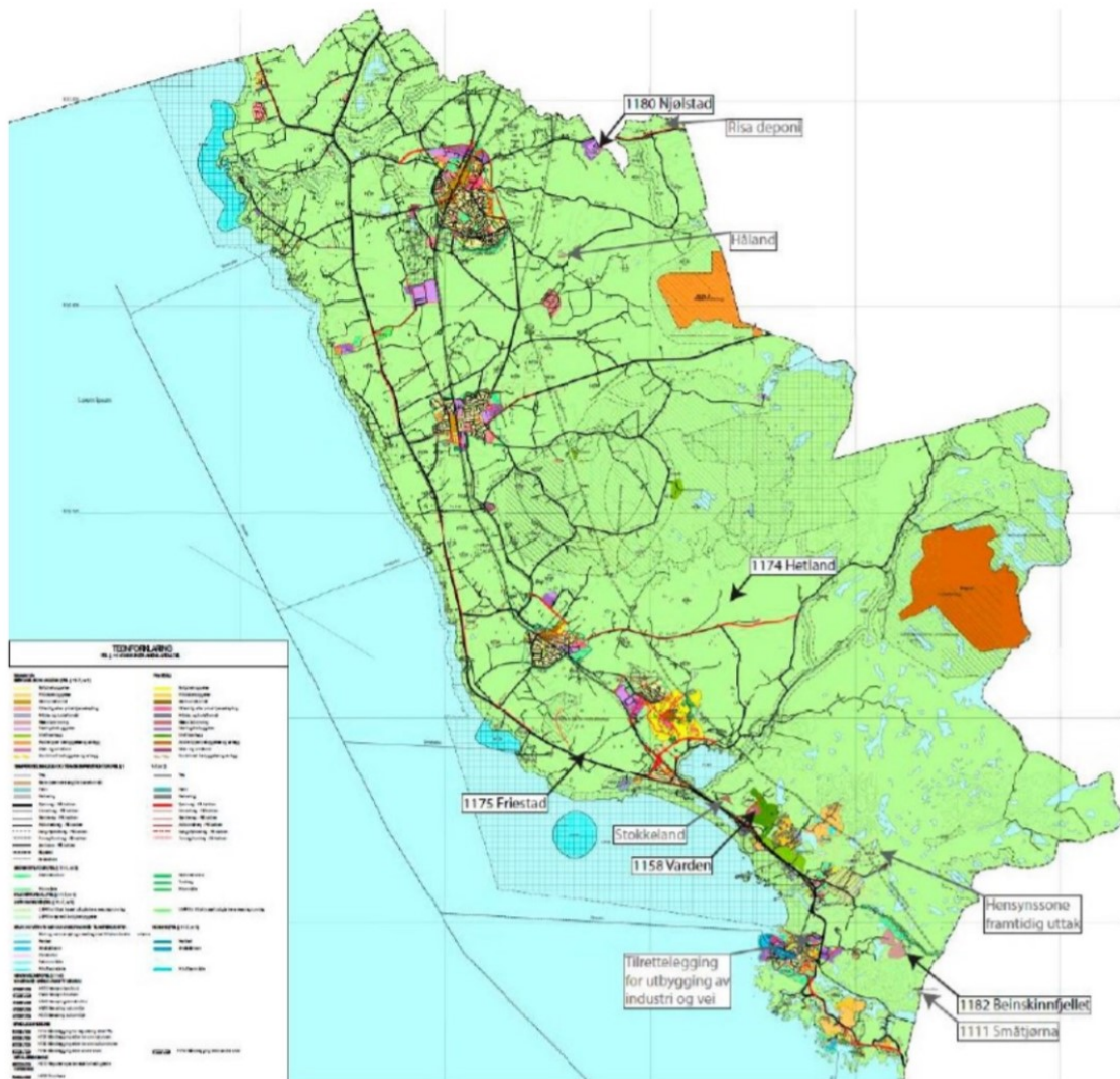
Figur 4 - Planforslag/eksisterende masseuttak i kommunen