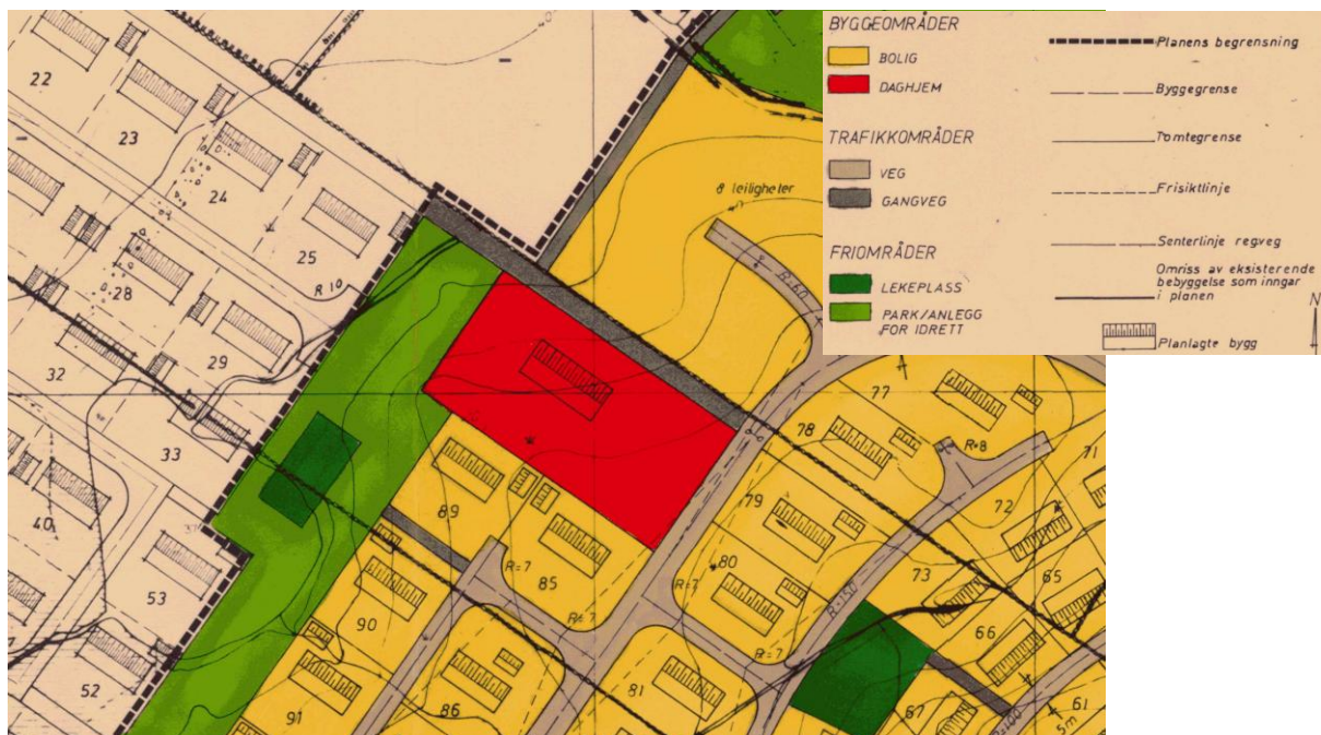
Figur 3: Utklipp av gjeldende reguleringsplan.