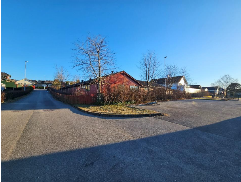
Figur 2: Foto tatt i Urheitræet av barnehagen og deler av parkeringsplassen.

Bildet er tatt i gaten Urheitræet og er vinklet mot sør for å vise gaten, barnehagen og deler av parkeringsplassen til barnehagen.