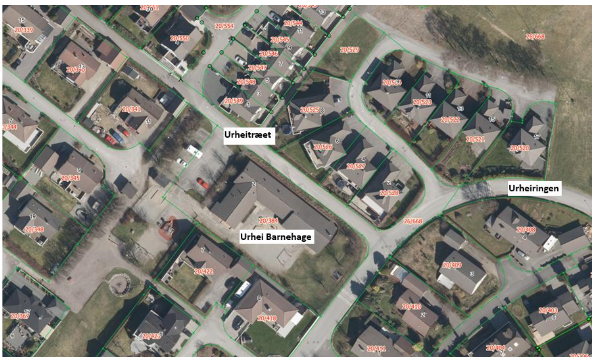
Figur 1: Ortofoto fra kartportalen til Hå kommune.

Ortofoto viser den tomme barnehagetomten sentralt i bildet. Sør for tomten ligger boligvegen Urheiringen. Langs den ene siden av barnehagetomten går boligvegen Urheitræet.