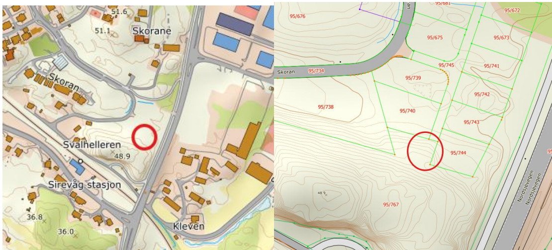
Området markert med rød sirkel